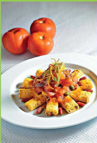
●彩虹一品土雞蛋($188)，用本地農場雞蛋與臘味煎成蛋卷，加上有機番茄粒、叉燒粒享用。

星期日(3月20日)是每年一度「全城有機日」，中環遮打花園及遮打道設有約一百個有機產品攤位及工作坊，並有食譜創作比賽等活動，大家可即場購買本土有機產品。此外，有餐廳及商場於3月下旬推出有機菜式及素食活動，呼籲大家響應綠色生活。