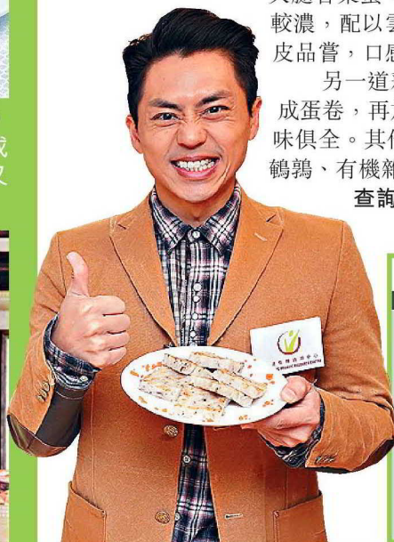
●森美擔任「全城有機日」星級有機大使。

查詢：2016全城有機日/www.hkorc.org、海景軒/2731 2883