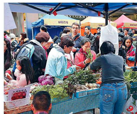
●中環遮打花園及遮打道將設有約一百個有機產品攤位。