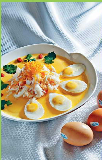
●龍王歡樂鷓鴣($228)，用本地農場雞蛋製作蒸水蛋，加上鷓鴣蛋、蝦肉等，清淡鮮香。