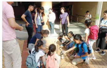
「再生能源工作坊」試驗太陽能車