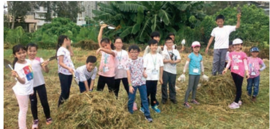
有機農田工作體驗