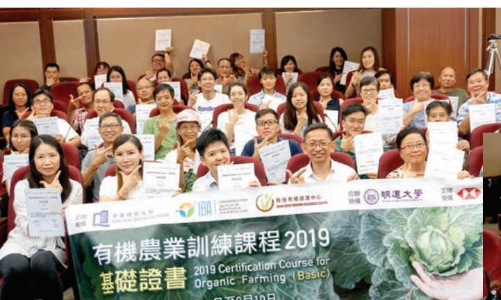
「基礎證書課程」和「進階證書課程」畢業典禮