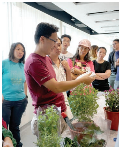
學員於課堂上認真聆聽相關理論及教授的示範。