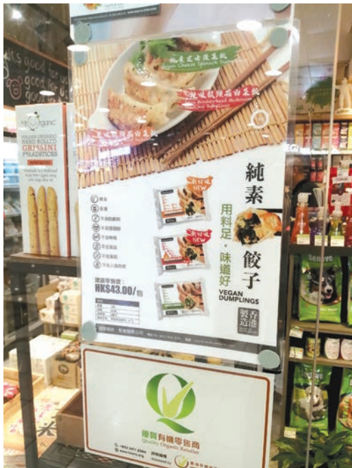
「一素店」自家製的純素餃子。