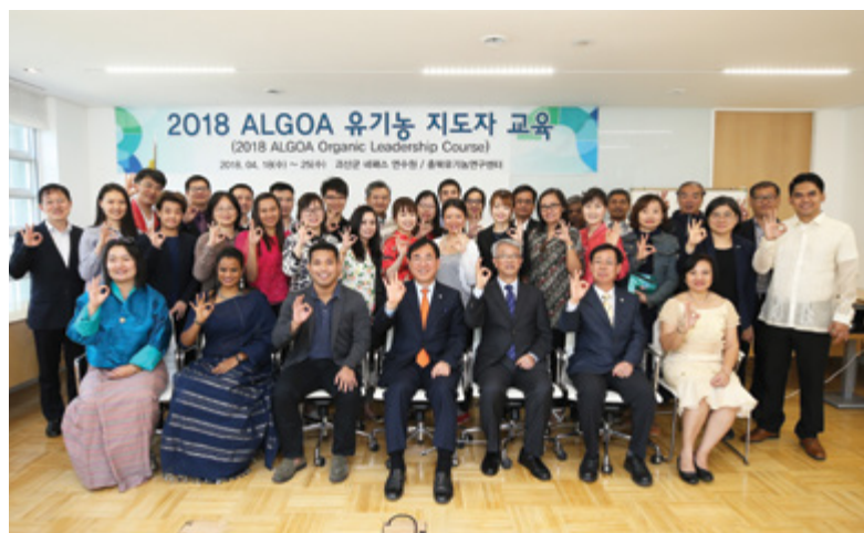
29名學員來自12個亞洲國家，一同做出Organic 3.0 的手勢。

是次培訓課程及參與第四屆亞洲地方政府組織委員會峰會，得著甚多。首先，從各國代表的分享中了解到不同地區有機發展情況，例如印度、菲律賓、中國及台灣等，不同地區的文化造就了不同有機運動發展，當中有很多香港可參考及學習的地方。例如韓國的有機生產組織 Hansalim 對農民的重視、台灣政府對有機活動的支持、以及印度和菲律賓的農民對有機耕作的熱誠，以致他們經營有機做得很成功，能一條心做出「真有機」，這一切也是香港人要學習的地方。