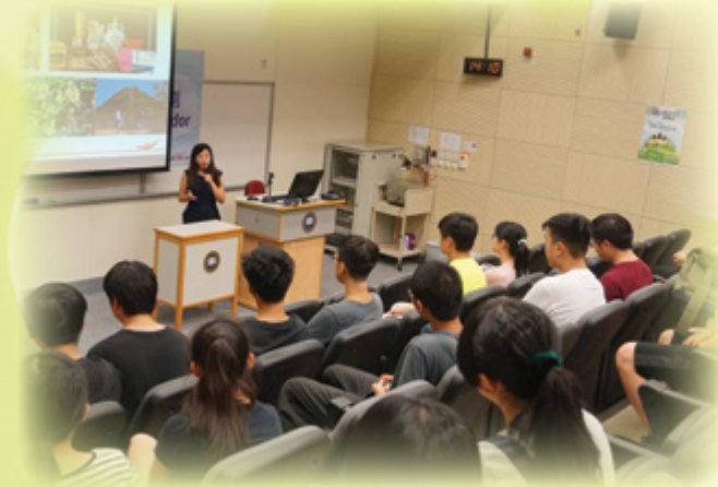
有機大使活動：綠色講座

中心以「生物資源與我們」為主題，於浸會大學校園內舉行了一場綠色講座，並有幸邀請到漁農自然護理署自然護理主任劉苑容博士到來與學生分享交流。