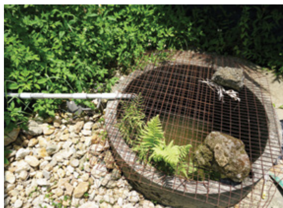
農場內設有一個井，用以灌溉場內農作物。