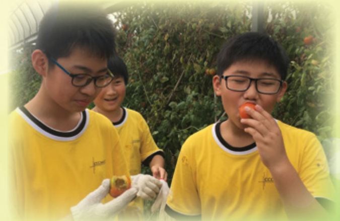
有機大使活動：當一日農夫

中心以「生物資源與我們」為主題，於浸會大學校園內舉行了一場綠色講座，並有幸邀請到漁農自然護理署自然護理主任劉苑容博士到來與學生分享交流。