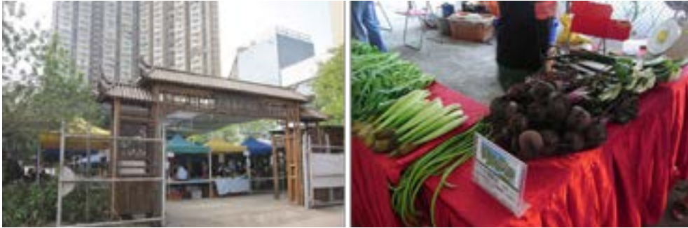
大埔農墟（左）及美孚農墟（右）。