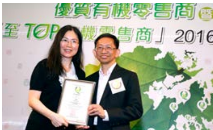
本年度共有44個參賽單位獲「優質有機零售商」稱號。