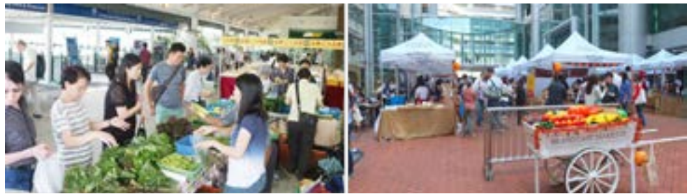
天星農墟（左）及港島東農墟（右）。

每逢週三及週日，高樓林立的中環亦會出現一片綠色。由環保協進會、嘉道理農場暨植物園及天星小輪有限公司主辦的天星農墟亦是市民另一個心水的有機採購地。在這裡，市民可以找到不少持有有機認證證書的菜農攤位。透過鼓勵市民購買本地有機農產，縮短運輸里程，天星農墟的成立望能減緩全球暖化，推動本土經濟及環保教育，同時在消費者和本地農友之間建構一個互助平台。