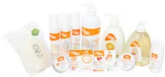
為嬰孩而設的 Baby Gaga 系列。