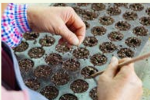
大龍實驗農場員工正在進行育苗。

現任漁農自然護理署助理署長(農業)的廖季堅獸醫不知不覺間已經在漁護署任職十多年，大家更親切地稱呼他為廖Sir。同時他也是香港有機資源中心認證有限公司監督委員會成員之一，在推動香港有機耕作的道路上，廖Sir可謂功不可沒。