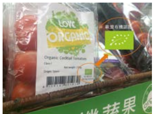
獲得歐盟認證的車厘茄。