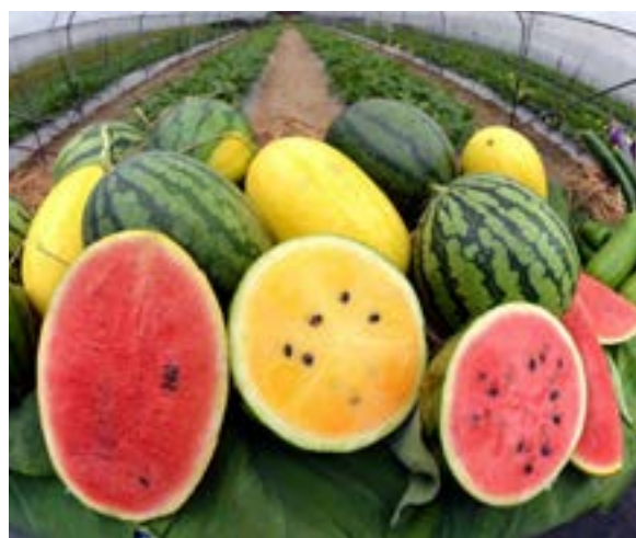
有機西瓜品種：黛安娜（前左）、玉蘭（前中）及超甜黑美人168（前右）。

夏天剛過去，大家有沒有品嚐到美味的本地有機西瓜？我相信讀者都十分了解「食得有機」的重要性，特別是近年進口食品的安全問題時有出現，令人擔心西瓜的甜味是否「藥水甜」，亦會憂慮農夫有否使用催熟劑種西瓜等等，連吃飯後生果都如此不安，真的是「吃得提心吊膽」。既然如此，何不嘗試本地的有機西瓜？