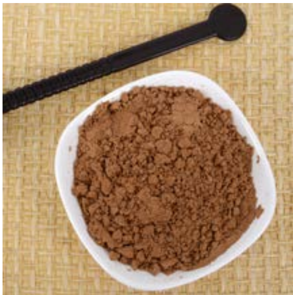
茶籽粉的使用份量可根據餐具油膩程度來調節。

茶籽粉（又名「苦茶粉」）是以油茶樹果實榨油後，剩下的茶渣磨粉製成的，過程中沒有加入其他添加劑，是天然の清潔劑。茶籽粉看似是近年才掀起的熱話，但原來古人早就發現了它的神奇功效。最早可追溯至明朝，人們把榨油後的油茶樹果實渣滓壓成一個大餅，名為茶籽渣餅，可以直接作肥皂使用，或者於需要時鑿下一塊溶解於水，來清洗衣服及碗筷等。而李時珍的本草綱目也明確記載著“茶籽去油膩”之描述。