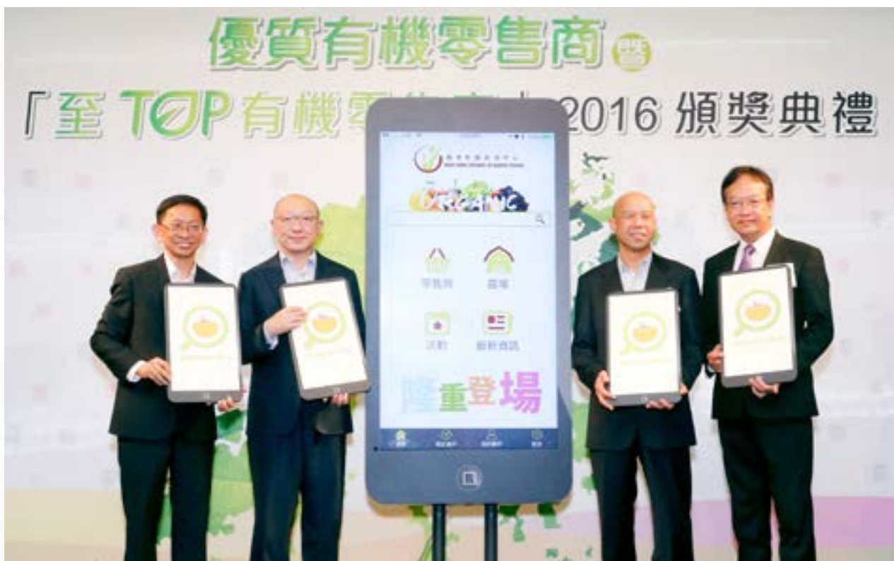
主禮嘉賓為 Organic Buy 主持亮燈儀式。

於「優質有機零售商」頒獎典禮同日，本中心在記者會上公佈了我們首個開發的智能手機應用程式「Organic Buy」，並邀請了食物及衛生局副秘書長馮建業太平紳士、漁農自然護理署助理署長(農業)廖季堅太平紳士、香港綠色有機生活協會主席黃家和太平紳士，以及中心總監黃煥忠教授MH太平紳士擔任主禮嘉賓，為「Organic Buy」的隆重登場主持亮燈儀式。