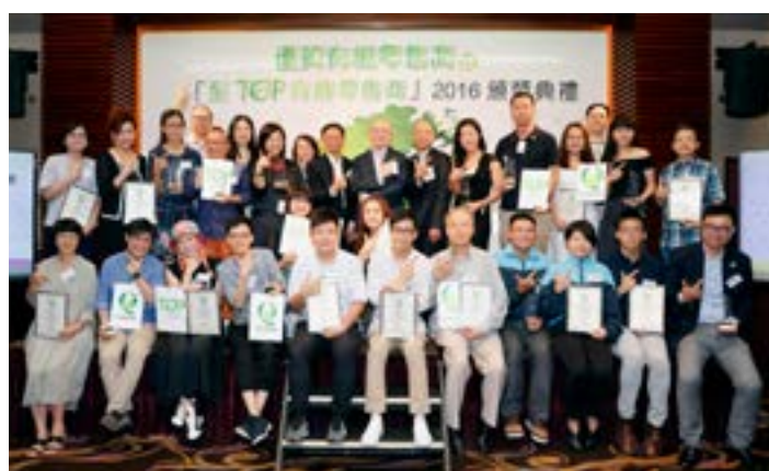
各得獎有機零售商代表及嘉賓合照留念。

中心於2016年6月29日舉行頒獎典禮，「優質有機零售商」2016得獎商戶名單如下：