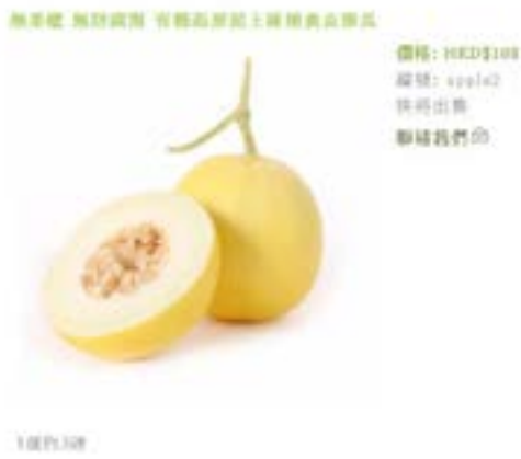
並沒有展示有機認證標籤

有些網上銷售的有機產品能夠展示清晰的有機認證標籤(左)，而部分有機產品則沒有相關展示(右)。