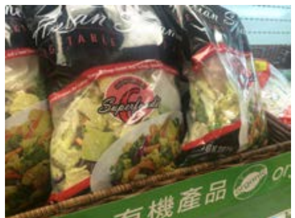
自稱有機的沙律菜。