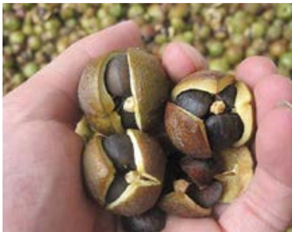
油茶樹果實含豐富油份，是食用油原料之一。