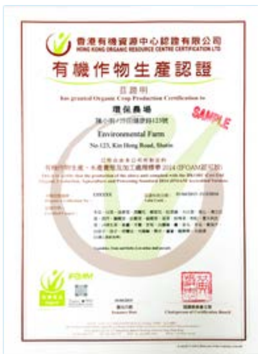
由本中心發出的有機認證證書。

隨著大家越來越關注食物安全,有機菜正變得越來越受歡迎。不過亦有不少市民提出這樣的疑問：究竟我們可以在哪裡買到真正的有機菜？除了常去的濕街市、超級市場外，或許你還可以選擇逛一逛香港的農墟。