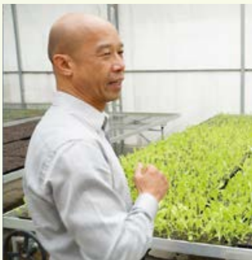
漁農自然護理署助理署長(農業)廖季堅獸醫，太平紳士。