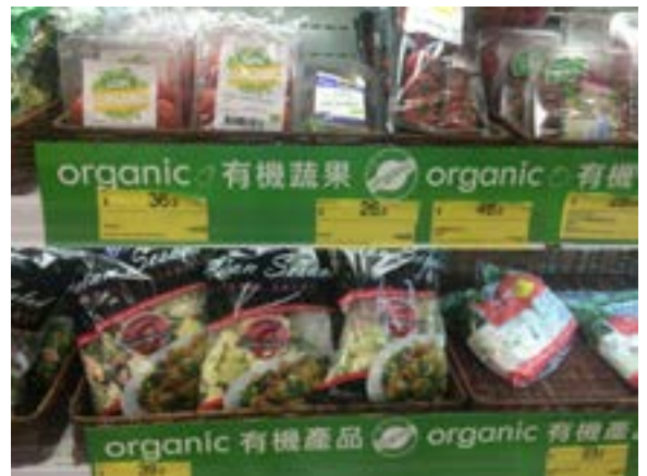
超級市場中的認證有機蔬菜(上)和自稱有機蔬菜(下)混合擺放在一起。

而長遠來說，中心希望政府待時機成熟便制訂相關法規，更好地保障市民大眾的利益，同時投入更多資源對市民進行教育，讓大眾更深入了解相關概念，以購買到真正適合自己的有機產品。