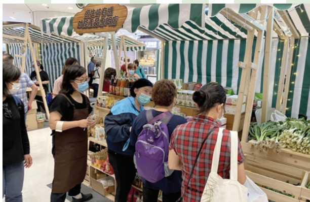
在場的優質有機零售商戶向市民推廣有機產品的好處。