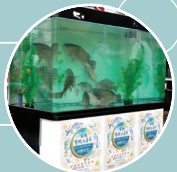
有機海產展示魚缸，展出有機羅非魚及寶石魚。