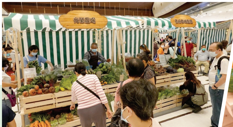
即日摘的新鮮有機蔬果引來市民的圍觀和挑選。