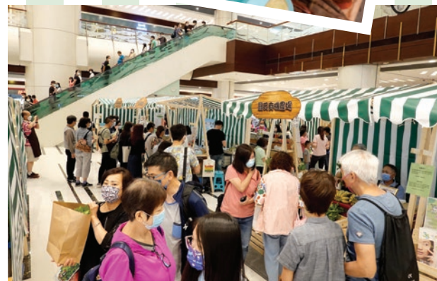
市集當日反響熱烈，吸引不少街坊和喜愛有機產品的朋友前來選購。