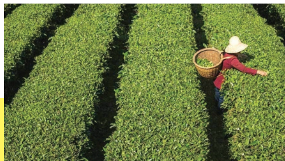
位於中國湖北省宣恩縣的茶園遵從公平貿易的環保方式種植茶葉。