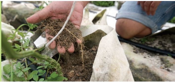
葉生到現在還是喜歡在田間捏一把泥土，感受一下泥土的濕度和養分。