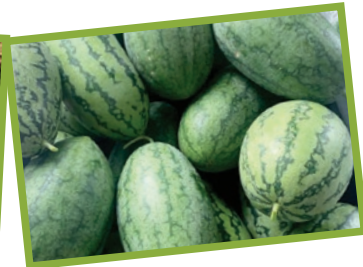
三寶樹農莊還有其他作物，如蕃薯、紅蘿蔔、西瓜等。