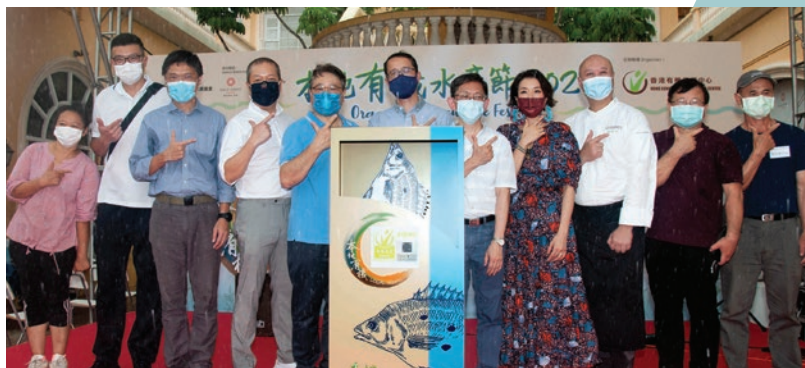
主禮嘉賓與在場一眾本地有機漁農友一同拍照留念