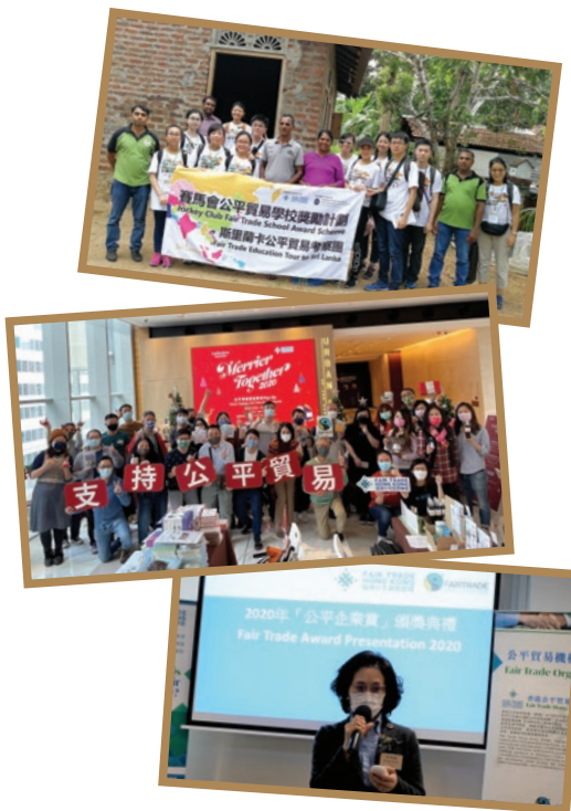
香港公平貿易聯盟獲香港賽馬會慈善信託基金贊助，在疫情前每年均會安排中學生到海外考察，以加深他們對公平貿易運作的認識。(上圖) 香港公平貿易聯盟於去年12月，於希慎廣場舉辦聖誕市集。(中圖) 香港公平貿易聯盟每年舉辦「公平企業賞」頒獎典禮，嘉許在推廣公平貿易有出色表現的企業和零售商。(下圖)