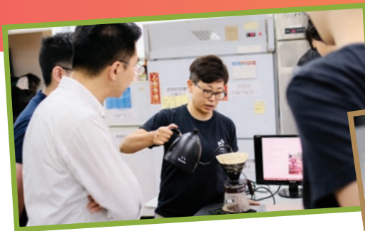
陳女士為「細味公平」的咖啡推廣作準備，(左圖)以及舉辦公平咖啡工作坊，讓參加者試飲。(右二圖)