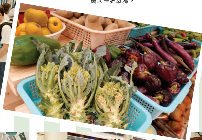
有機蔬果五彩繽紛， 讓人垂涎欲滴。