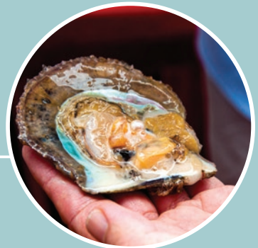
有機馬氏珠母貝於活動會場作首次公開展示。

設有機認證水產的展示魚缸，以及攤位遊戲、舞台表演，父母帶同子女享受另類「漁樂」，邊玩邊學，歡度一個綠色嘉年華！