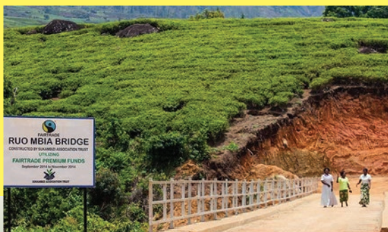
公平貿易社區保證金由當地居民投票決定如何使用，通常會作社區改善設施及培訓教育等用途。