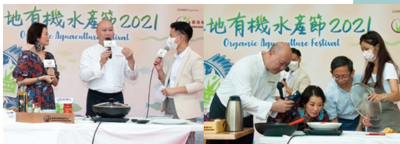
由星級有機主廚一營哥煮理的有機水產烹飪示範(左)及「有機水產·本地鮮味」低碳烹飪比賽總決賽的情況(右)