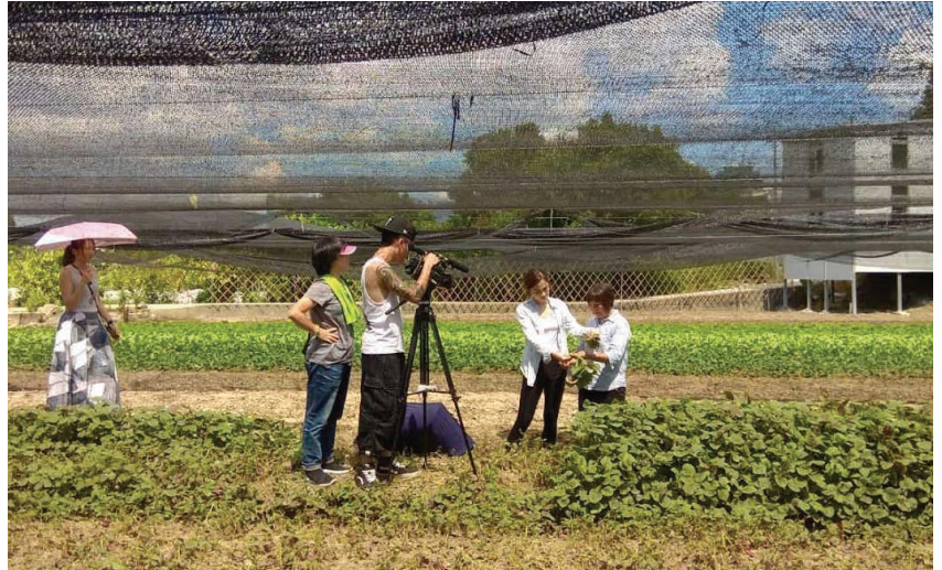
七娣姐與他的農田