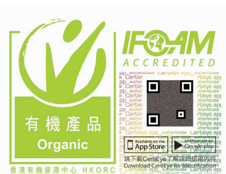
香港有機資源中心認證有限公司認證標籤