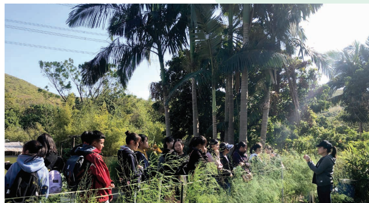
導賞員向參加者介紹有機認證農場的作物