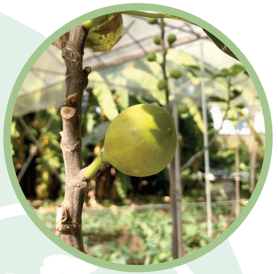
有機農場出產的無花果