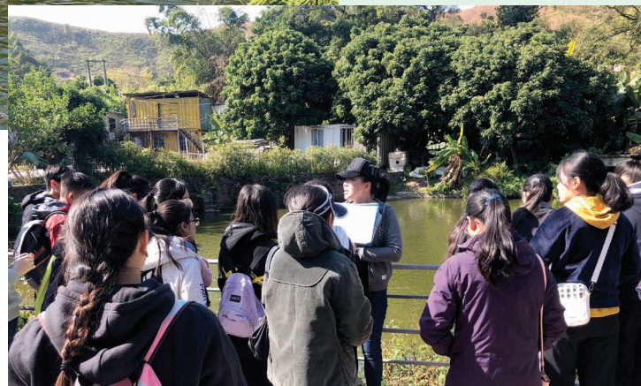
中心職員專業講解有機水產養殖

有機水產是指在天然或人工的水體以有機的方法培育水生動物。養殖過程需嚴格遵守有機生產、水產養殖及加工標準，包括飼養環境、魚苗來源、飼料選擇、養殖密度、日常飼養操作、魚類健康管理、運輸及屠宰過程等。魚塘內養殖的魚類數量、品種有一定的規定及因由，例如需要養殖不同類型的魚種以增加生態多樣性，屬生態鏈的不同位置，牠們吃的飼料也不能隨便，不能使用基因改造飼料，以確保有機魚不受污染，消費者才吃得放心。了解完有機魚的養殖，參加者亦能體驗餵魚之樂趣。