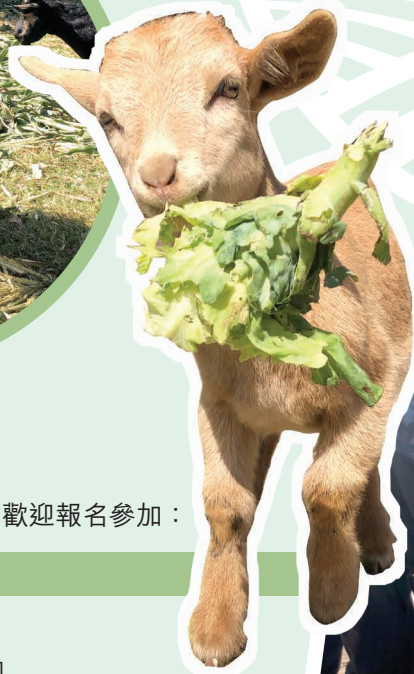
參加者有機會親親場內小動物