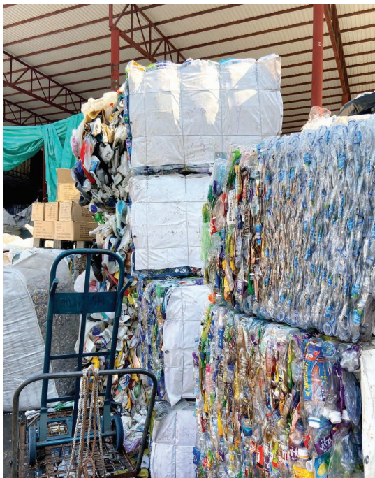
回收場放著一捆捆已分類好的回收物

分類回收推行多年，相信大家對三色回收箱並不陌生，但到底廢物落到回收箱後，它們會如何處置？底會被循環再造還是被送到堆填區？