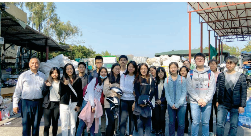
兩組有機大使分別於上午及下午參觀回收場