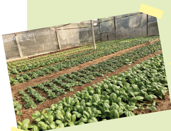
振生園有機農場田間整潔，整體管理優異。