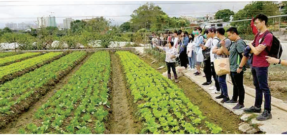
七娣姐向年輕人分享經驗