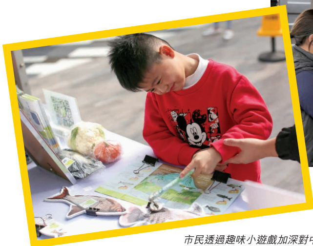
市民透過趣味小遊戲加深對中心有機標籤和有機認證的認識