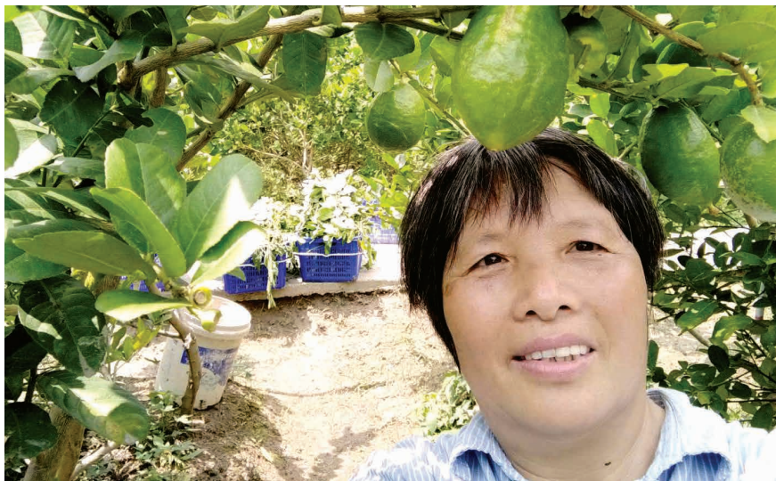
七娣姐和她的作物

後來，七娣姐曾經考慮轉型有機，但憂慮客源問題，直到受到一位已獲有機認證的朋友鼓勵，跟她說客源充足，不需擔心，七娣姐便決心轉型有機，申請有機資源中心的有機認證。