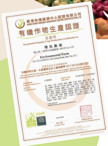
由香港有機資源中心認證有限公司 發出有機作物生產認證證書