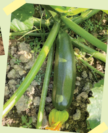
明輝農場種植的綠翠玉瓜水大肥足。