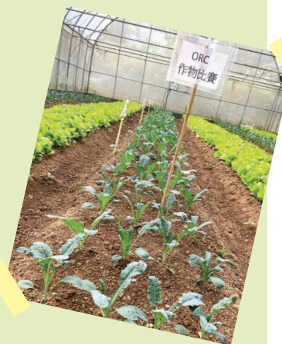
短短一個月，新生農場種植的羽衣甘藍已經根深葉茂。