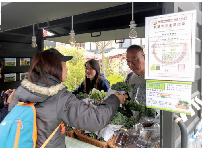
市民可以透過有機認證標籤及證書分辨是否真正的有機蔬菜。