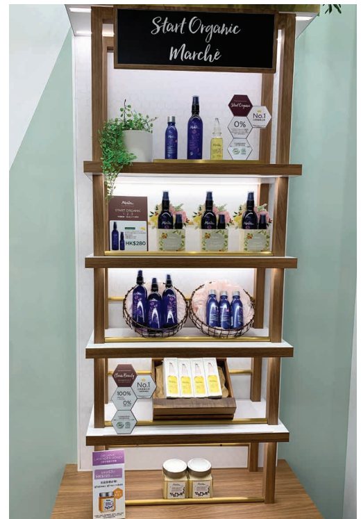
店內產品均設清晰指示，並標誌產品資訊，供顧客參考

對Melvita而言，取得ECOCERT有機認證不但是品牌賣點，更是一種對消費者的品質保證及環境保育的堅持。有機認證認可了產品的品質及生產過程對環境的保護，Melvita產品附有COSMEBIO及ECOCERT的標誌，代表在產品製造過程中完全沒有使用任何有爭議性的成分及大部分人造防腐劑，而Melvita亦力求完善，務求在成份、產品來源、生產方法、煉製方法及防腐保質方法各方面，都符合相關的環保有機標準，才能通過認證機構的認可。品牌認真落實其有機、無化學物的承諾，例如今年消費者委員會的潤唇膏檢測報告便顯示Melvita有機堅果保濕潤唇膏不含有害礦物油物質MOSH或MOAH。