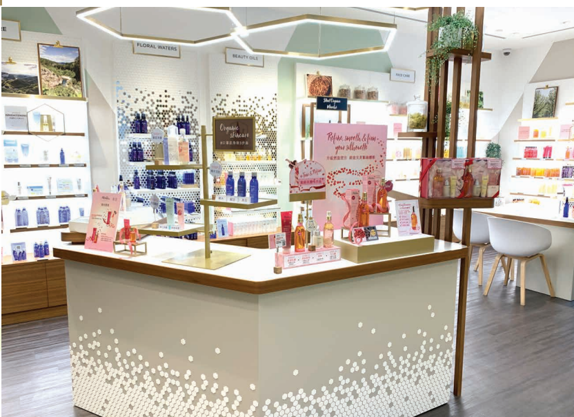
店員每日清潔，保持專門店店鋪環境整潔