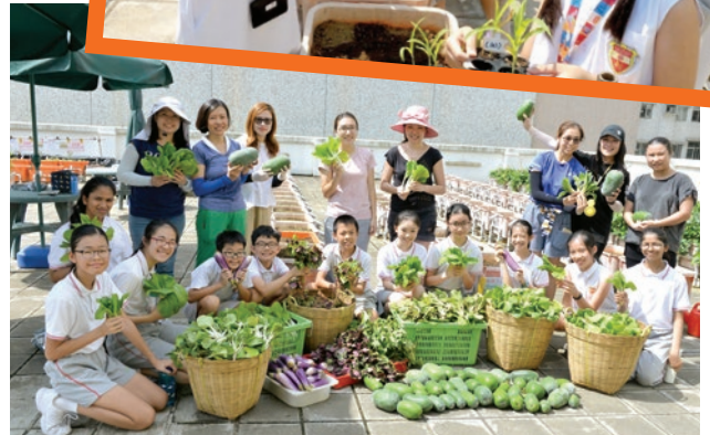
學校透過有機耕種讓學生在動手做的過程中學習多元化知識和基礎能力訓練。