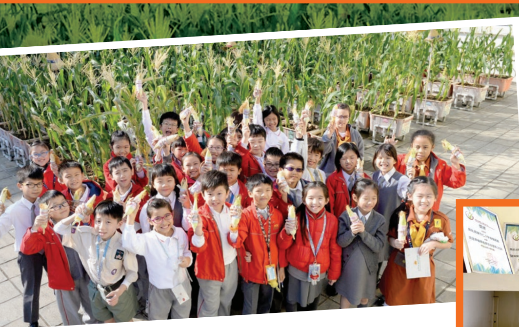
「保良局陳守仁小學有機園圃」是本港第一所取得國際有機認證的學校。