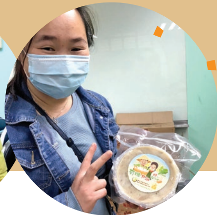
雖然戴著口罩，但看見市民領取到有機蘿蔔糕後的笑顏，令中心職員倍感欣慰 — (循道衛理觀塘社會服務處 — 神愛關懷中心)