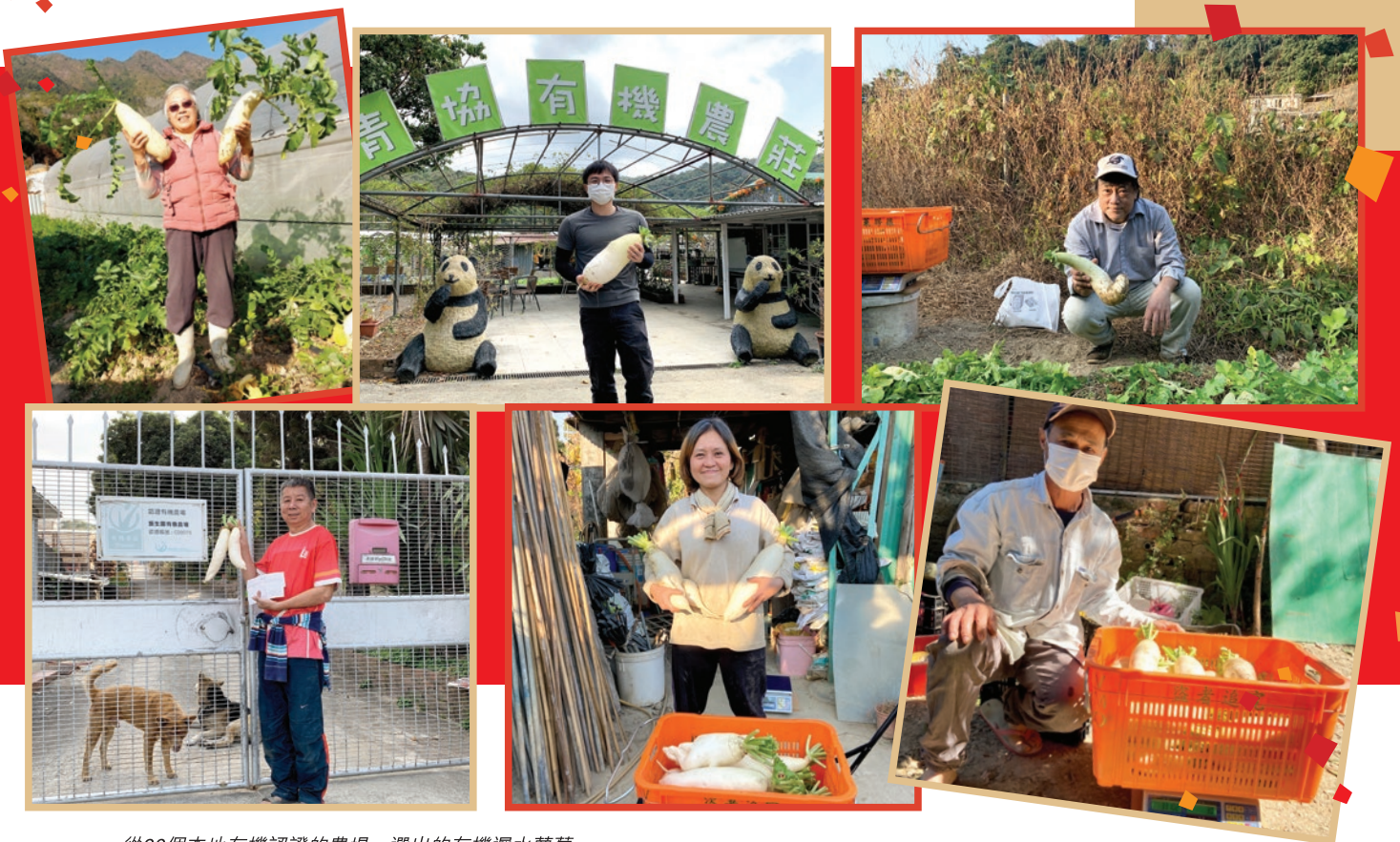
從30個本地有機認證的農場，選出的有機遲水蘿蔔。

有機蘿蔔糕的主要原材料—有機遲水蘿蔔是選自2020年度「本地認證有機農場比賽」中的30個有機農場。而遲水蘿蔔是指比較遲種植的意思，一般下種的時間為十一月初，大約種植九十天可以收成，農曆新年前後正是遲水蘿蔔當造的季節。