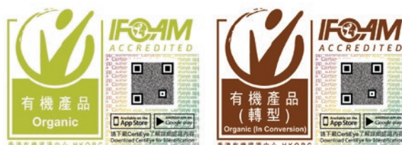
有機農產品或含有不少於95%有機材料的加工產品