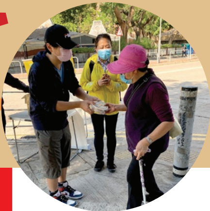
派發有機蘿蔔糕概況 — (HKEA香港教育協會)