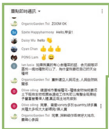
分享會期間參加者均全情投入及踴躍發問。

5場的網上分享會中，共有接近500名市民報名參加，網上總觀看次數亦達14,000次。同時，分享會期間參加者均全情投入及踴躍發問，可見市民對本地農業及可持續生活的議題有相當的關注度。