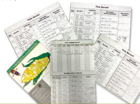
透過填寫田間紀錄，讓學生學習紀錄管理。