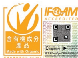
含有不少於70%但不多於95%有機材料的加工產品