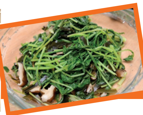
園圃的收成除了會供給學生的日常飲食之用外，更會把作物捐贈到社福機構。